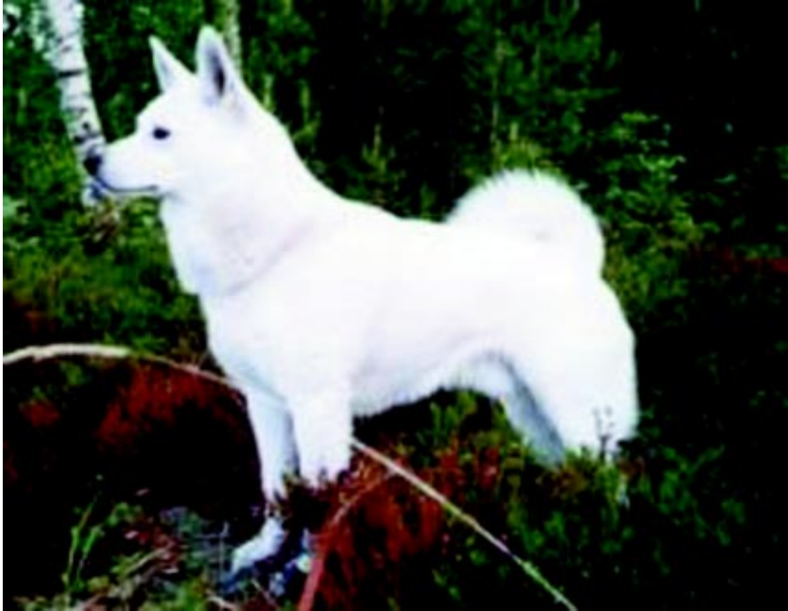
Hane av utmärkt typ