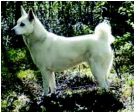
Tik av mycket god typ med lång rygg