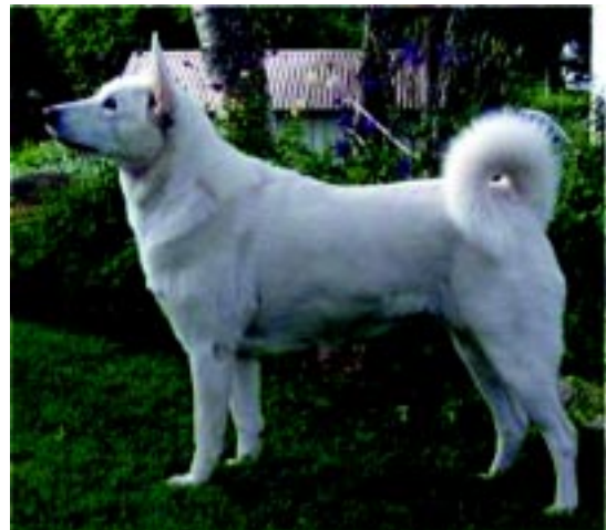
Tik av god typ (hanhunds betonad) alldeles för tung