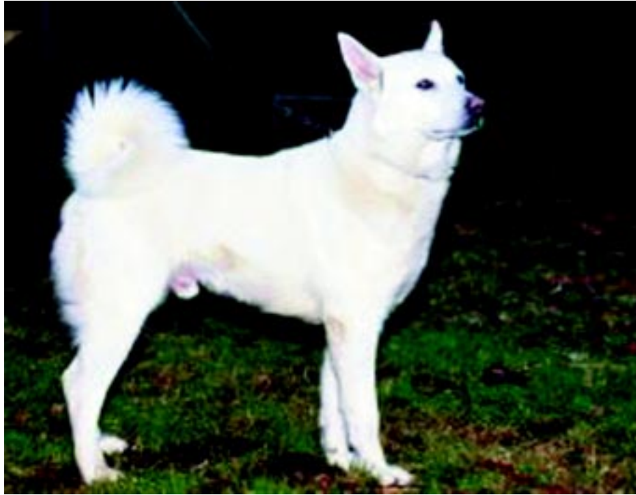
Hane av mycket god typ dock med för hårt ringlad svans