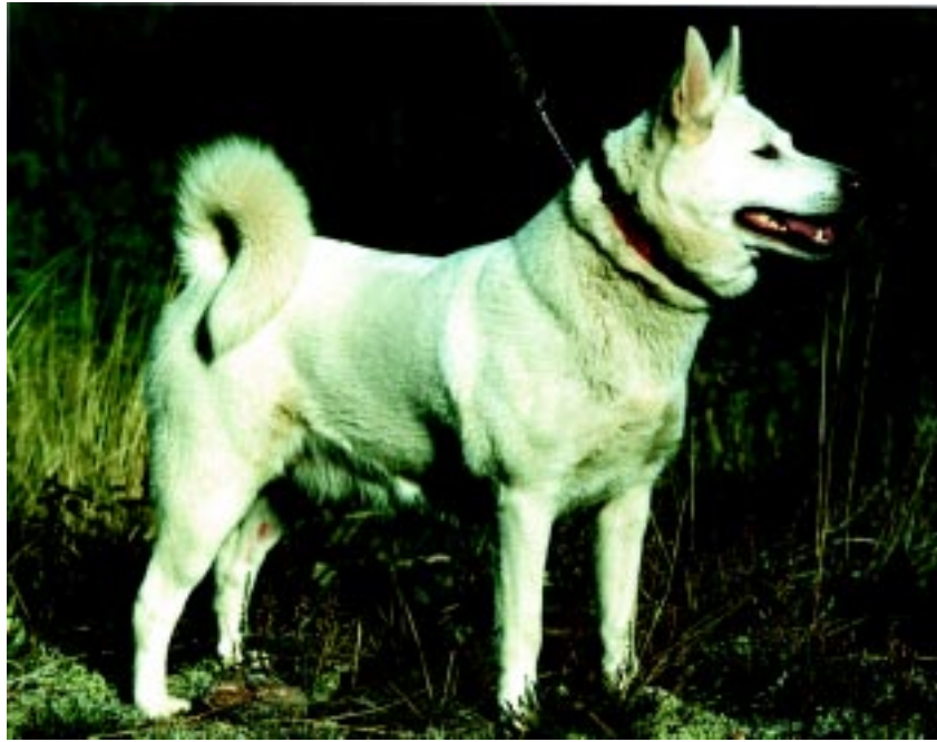
Tik av mycket god typ med eftergivande rygg